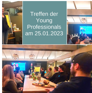
Young Professionals aktivpark Kalt Januar 2023