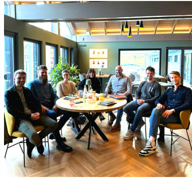
Planungstreffen Young Professionals