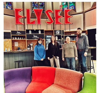
Besuch im Digital-Hub Aachen