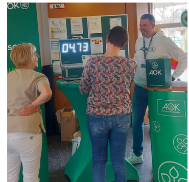
Gesundheitstag Communio in Christo