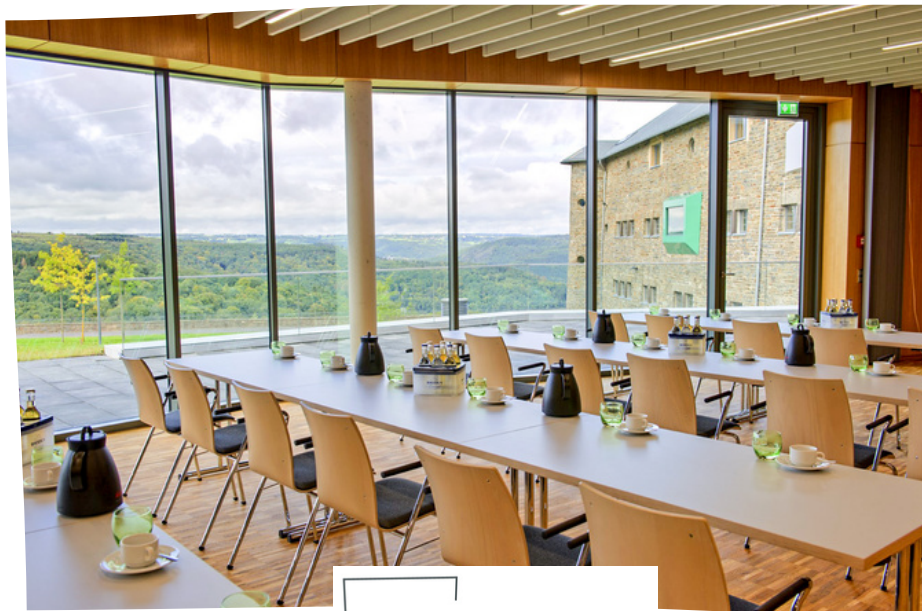
VOGELSANG IP IM NATIONALPARK EIFEL

An diesem historisch bedeutenden Ort haben Unternehmen die Möglichkeit, Veranstaltungen inmitten der atemberaubenden Natur des Nationalparks Eifel in modernsten Tagungsräumen mit Panoramablick durchzuführen. Für Partner-Unternehmen gibt es einen Rabatt von 10% auf die Tagungsräume . Das Kulturkino Vogelsang IP bietet in einer einzigartigen 1950er-Jahre-Atmosphäre auch für Ihre Betriebsveranstaltung die optimale Lösung.